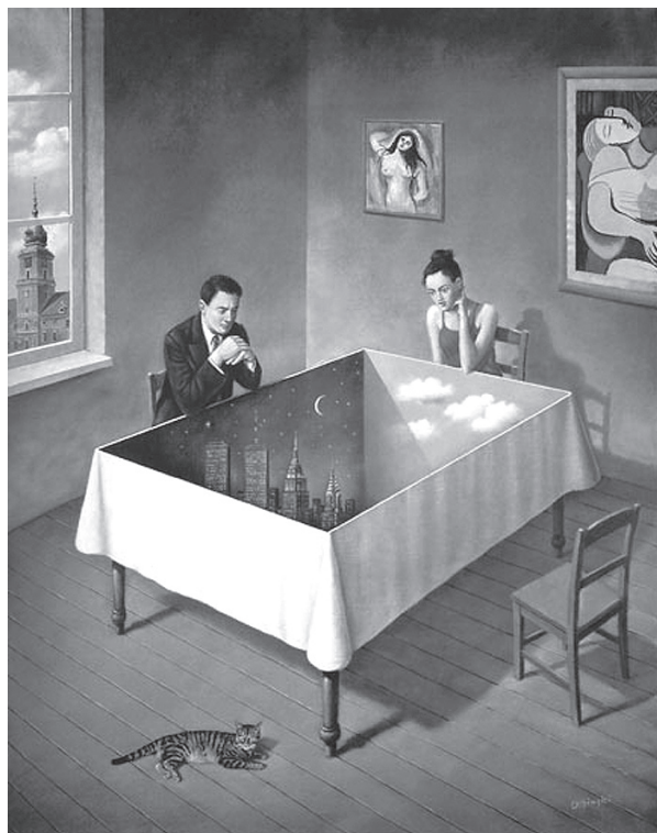
Inocența intențiilor de curtoazie

Acasă nu te întorci pentru a face bani. Pentru că, vorba poporului, „slabe șanse”. Acasă nu te întorci pentru Chișinăul frumos, arhitectura interbelică sau gradul de cultură promovată prin orașe. Pentru că, vorba poporului, „nicio șansă” (chiar de avem schimbări la capitolul cultură). Acasă nu te întorci pentru că simți că alții au nevoie de tine aici, pentru că simți că țara are nevoie de tine. Tu trebuie să ai nevoie de această țară. Oricât de mică și tumultuoasă ar fi; oricât de crispată, gri și neprimitoare e uneori; oricât de obsedată de aceleași vechi cicatrice, rotindu-se în cercuri vicioase – acasă te întorci pentru că ești bolnav de țara ta. Pentru că, departe fiind, continui să-i citești în limba ta pe scriitorii tăi, pentru că, oripilat și obosit fiind deja, tu continui să urmărești știrile politice de acasă, pentru că atunci când pe playlistul tău ajunge o doină sau un ion – ți se frânge inima și se umezesc ochii, pentru că iubești și când iubești, vrei să o atingi cu mici, dulci cuvinte de-acasă, pentru că ura și argumentele tale raționale despre „de ce nu m-aș întoarce acasă” nu pot să se împotrivescă gândurilor alea înainte de somn când alergi desculț pe drumuri nebatătorite, acoperite cu frunze de toamnă aurie sau cu iarbă verde de pădure și ești... ești acasă.