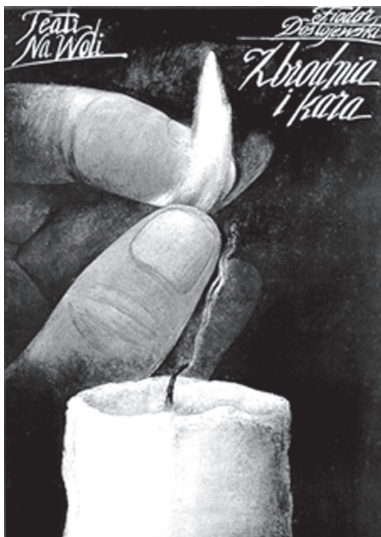
Crimă și pedeapsă, Wiktor Sadowski

memoriei care se dezvăluie greu și incomplet, ca în Cartea neagră . Avem povești despre dileme identitare în Fortăreața albă . Și avem caleidoscopul de stranii înfățișări, care se sfarmă și se reface perpetuu, în Mă numesc Roșu . Cărțile lui Pamuk sunt ilustrarea unui amestec între Orient și Occident. Și la nivel strict narativ, nu doar la nivel de idei, regăsim această tradiție turcă sau persană de a spune povești, de a clădi o narațiune în narațiune, pe sistemul celor 1001 de nopți . Pe de altă parte, în creația lui Pamuk există o profundă cunoaștere a romanului european. În cărțile lui simți toată istoria romanului european, transformată de aromele orientale. Istanbulul e prezent în toate cărțile. Mai mult decât atât, mottoul romanului despre Istanbul spune că orice peisaj este mai interesant prin melancolia pe care o degajă. De această melancolie și nostalgie sunt pătrunse toate cărțile. Peste tot, la un moment al narațiunii, găsești pasaje dedicate Istanbulului, de la