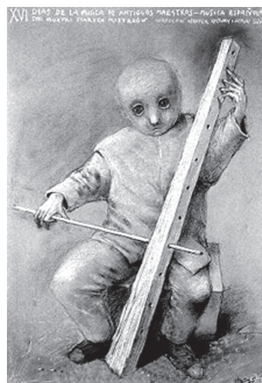
XVI Dias de la musica de antiguos maestros, Stasys Eidrigevicius

Fiind întrebat de ce scrie, Orhan Pamuk afirmă că doar această activitate îl face într-adevăr fericit. Doar scriind renaște în sufletul său dulceața sentimentului copilăresc de bucurie, căci adultul din el scrie cu o ardoare aidoma celei cu care picta copilul din el. Cei care îl cunosc pe scriitor mai bine înțeleg că orice lucru care îl ține pe Orhan Pamuk departe de birou, foaie și stilou nu va izbuti niciodată să îl facă fericit. De dragul acestei fericiri, care îi este mereu la îndemână, scrie și va continua să scrie.