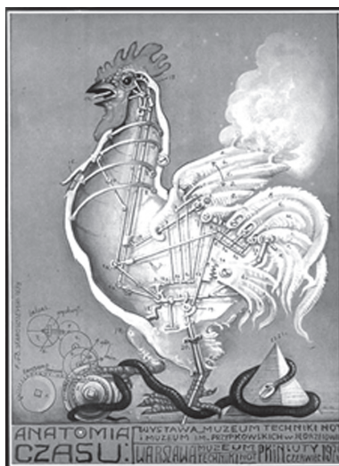
Anatomia timpului , Franciszek Starowieyski

Istanbul și a început să scrie. De atunci, Pamuk s-a situat pe traiectoria sigură către Premiul Nobel pentru literatură. Primul său roman, Cevdet Bey și fiii lui , a fost publicat șapte ani mai târziu, în 1982. În 1985 e profesor la Universitatea din Columbia și la Universitatea din Iowa. Destinul îi mai oferă un loc printre membrii juriului la Festivalul de Film de la Cannes în 2007 și un post de lector la Harvard în 2009.