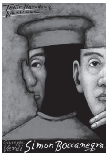
Simon Boccanegra, Mieczysław Górowski

testabil faptul că țarul reformator a pus bazele unei politici imperiale, dezvoltate cu succes, îndeosebi de Ecaterina II. Încă în secolul al XIX-lea, istoricii, analizând politica externă a țarismului, afirmaseră că în epoca Ecaterinei II a fost stabilit scopul principal, niciodată uitat și pas cu pas apropiat – Constantinopolul . Aceeași țintă însă urmăreau și Habsburgii (Austria ajungând la acea vreme o putere balcanică ce promova insistent o politică anexionistă referitor la Principatele Române). Această interferență de interese determină rivalitatea ruso-austro-turcă în Peninsula Balcanică.