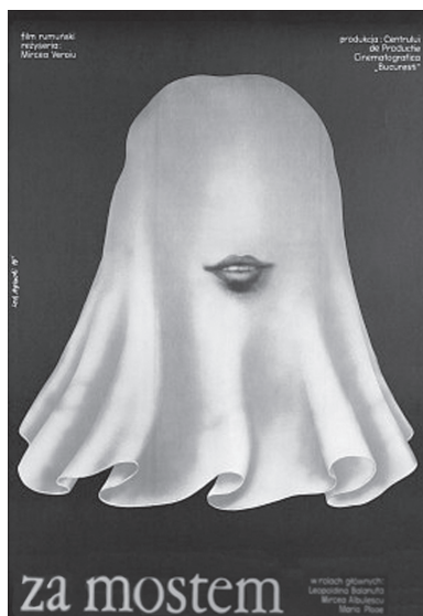
Dincolo de pod, Lech Majewski

Încet, încet, prin această muncă istovitoare, turnul se înalță mai bine văzut spre cer și se lua la întrecere cu șiragurile împietrite de natură. Treceau ore, zile, luni sau ani? Nu mai erau de folos stelele în