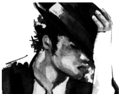
Mickael Jackson, Andy Warhol

Omul a răspuns că nu a văzut nimic deoarece era dezamăgit că văzuse exact ceea ce își imaginase, de atâtea ori. Oamenii, aproape întotdeauna, văd ceea ce vor să vadă, dar nu ceea ce există de fapt. În unele cazuri acest lucru nu funcționează.