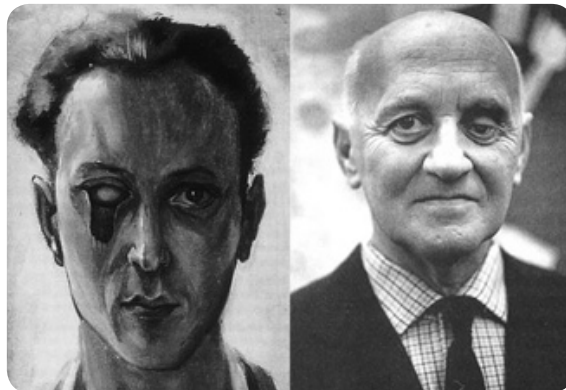
Autoportret, Victor Brauner

Textul lui Le Clézio este o narațiune a unei călătorii atât în spațiu, cât și în timp. Totul devine călătorie, una spirituală. Călătoria lecleziană ne conduce într-un univers care este în noi,