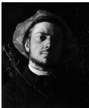
Paul Verlaine, Jean Frederic Bazille

În carte este menționat Alphaville-ul, orașul fictiv al lui Jean-Luc Godard, unde „cei care plâng sunt arestați și executați în public... pentru că nu au voie să aibă sentimente profunde”. Aș pune la îndoială inexistența acestuia având în vedere că