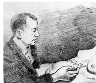
Paul Eluard, René Magritte

Timpul de astăzi, conchidem, e programat să se trezească la