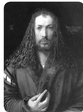
Autoportret, Albrecht Dürer

Cărțile plasate în secțiunea „Interzise din motive religioase” aparțin celor mai importante religii, dar, totodată, cuprind și lucrări clasice de filosofie și știință, care reprezintă moștenirea intelectuală a lumii. Biblia este printre cele mai cenzurate cărți și totuși are cele mai multe traduceri și în mai multe limbi decât orice altă carte în istoria cărților. Coranul este cea mai influentă carte din lume, alături de Biblie . Istoricul demenzii oferit de volumul dat ne demonstrează că interzicerea studierii lor, arderea nu le-a împiedicat să devină cele mai citite texte sacre. Cenzurată a fost și Originea speciilor , Charles Darwin fiind acuzat de a-l fi „de-tronat pe Dumnezeu”, după opinia criticilor și clericilor din întreaga Anglie. Capodopere originale și îndrăznețe precum Roșu și negru de