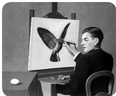
Autoportret, René Magritte

Capitolul „Cărți interzise din motive politice” ne duce imediat cu