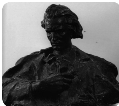
Mihai Eminescu, Lazăr Dubinovschi