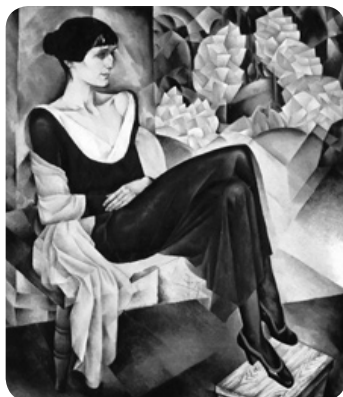
Anna Akhmatova, Nathan Altman.

În aceste zile, când pe continentul nord-african, în Libia, se consumă drama unei revoluții atât de sângeroase, încât Revoluția Română de la 1989 ți se pare joacă de copii, când supertehnologizata Japonie este continuu scuturată de cutremure, vălmășită cu Pacificul de tsunami și (ca și cum nu ar fi destul!) sub pericolul autoexterminării nucleare, drama tragice tale Basarabii ți se pare imens mai mică. Nu-ți mai da mâna să umbli cu drapelul politicii populare sus, căutând să întorci ochii lumii către acel punct al Europei unde ți-a fost dat să deschizi ochii: – Priviți către Prut! Acolo suntem noi, marginea de est a latinității! Noi, așchie de popor românesc, cărora ni s-a impus un război care nu e al nostru! Nu ne lăsați! Ați mai făcut-o de atâtea ori! SOS!