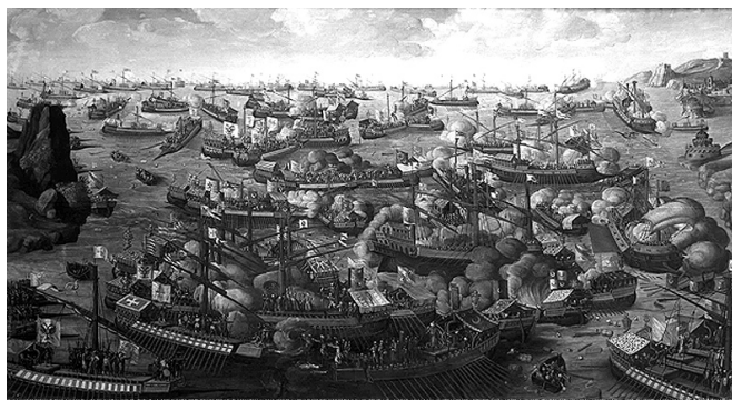
Bătălia de la Lepanto, Yogesh Brahmhatt

Important este să ținem cont că e o carte a momentului și, asemenea unui vaccin sezonier, trebuie administrată la timpul convenit, pentru a nu fi prea târziu. Căci ajungi la 17 ani și nu-i mai pătrunzi farmecul, nu te mai