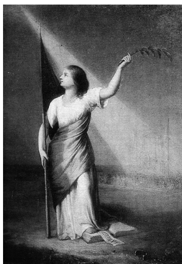
România rupându-și cătușele pe Câmpia Libertății, Constantin-Daniel Rosenthal

nilor, asta nu are priză la public! E o tactică mult prea «fumată», chiar de se încearcă a o camufla în chipul amintirilor din copilarie”. Iată, bunăoară: „Cărțile sunt asemenea unor fluturi. [...] Pe aripile fluturilor noștri de hârtie, asemenea unor solzișori ce irizează lumina, sunt tatuaje ciudate, înscrise cu cerneală tipografică. A trebuit să mergem la școală ca să le deslușim.” – Mircea Cărtărescu. „Un important pas înainte pe lungul și spinosul drum al cititului l-a constituit întâlnirea mea cu atlasele. [...] O comparație între «scrisul» meu de pe Cartea de bucate și cel de pe Dicționarul enciclopedic arată că mâna copilului care ținea