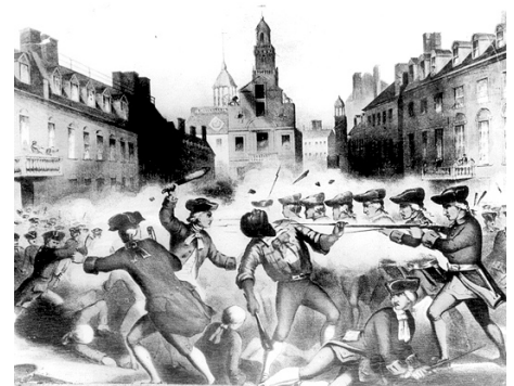
Masacrul de la Boston, John Bufford

Memorii. 1907-1960, Editura Humanitas, București, 1997.