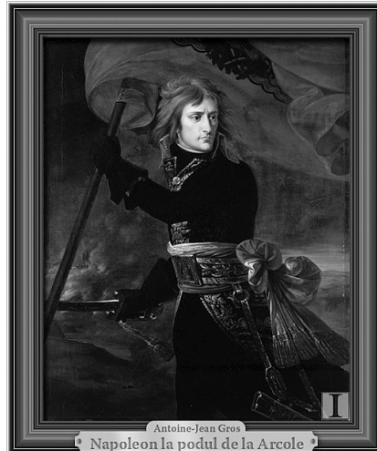
Bătălia de la Arcole, Antoine-Jean Gros

regularitate la concursurile „Tinerimii române” și nu dobândisem nici măcar o mențiune. Îmi amintesc de concursul din clasa a VI-a.