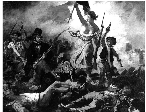
Libertatea conducând poporul, Eugène Delacroix

Țara noastră istorică cunoaște bine războaiele de cucerire, pentru că, aflându-se la răscrucea unor