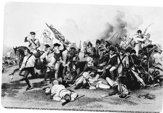
Bătălia de la Camden, Alonzo Chappel

iarba luminează la fel ca luna (ca un disc de mușchi), dar eu nu știu despre ce fel de iarbă vorbeau. Să lipești etichete pe suflet nu-i bine – codurile diabolice de bare înfipite în plafonul cabaretului; stră-strămoșii noștri se dădeau în public cu ocru, ai noștri se despart de inhibiții sub ocrul lampioanelor. Lumea are unghiuri pe care e mai bine să nu le cunosc. Stâlpii mi se par oameni, oamenii mi se par tulpini de bambus, ce gândirăm s-a disipat demult ... și toți se plasează după diacriticele visării. Case ruinate – ce-aș da să-și scuture din nou pletele!