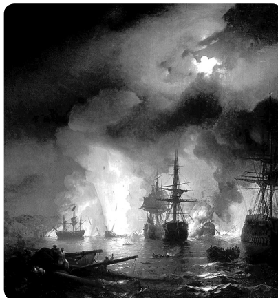
Bătălia de la Cesme, I. C. Aivazovsky