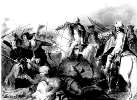
Primul succes al lui Washington

În mod normal, ar fi trebuit să ieșim din zodia naționalismelor concurente, cel puțin în interiorul spațiului nostru național, românesc, încă de pe la începutul secolului al XX-lea. Inițial, așa părea că se întâmplă. Imediat după 1918, se