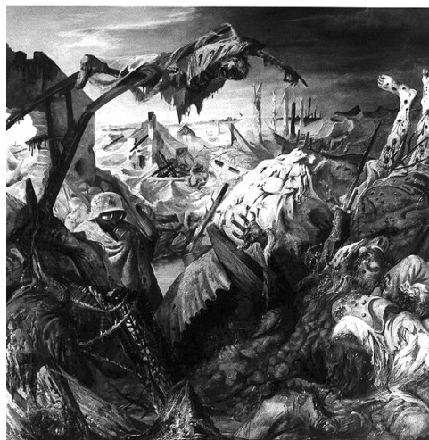
Triptic, Otto Dix

Adevărul, s-a născut această carte. Iar în vremuri de mari frământări, adevărul trebuie apărat. În opinia mea, la asta se rezumă și asta face