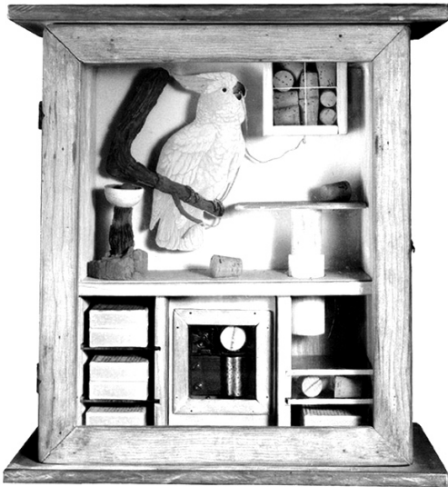
Cacadu și dopuri de plută

poate, zic eu, nu o dată, voința apare și se manifestă (solicitată fiind!) în urma unor prime imbolduri de spontaneitate artistică, de unde și presupunerea că numai cu inspirația nu faci totul. Voința – totdeauna benefică, probabil – ca o rațiune aservită sieși. Voința de a-ți folosi... voința, pentru a te supune, prin ea, ei înseși, dar și ție însuși.