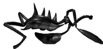
Femeie cu gâtul șliț

Intuitiv sau pe deplin conștient, unii scriitori ajung la prescripții similare, urmându-le, ce-i drept, în mod personal, în conformitate cu specificul îndeletnicirilor lor. Prietenii și apropiații fraților Goncourt erau de părere că aceștia au o școală proprie de elaborare și prezentare a experienței: acumulau mormane întregi de petits papiers (notițe), referitoare la viața psihologică a contemporanilor,