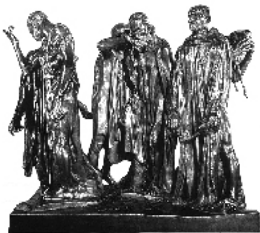
Burghezii din Calais

În premieră, copiii din întreaga lume au putut participa la acest sondaj global. Ei au constituit cel mai larg grup de votanți. Copiii până la o anumită vârstă nu au un simț puternic al mândriei naționale, deci ei