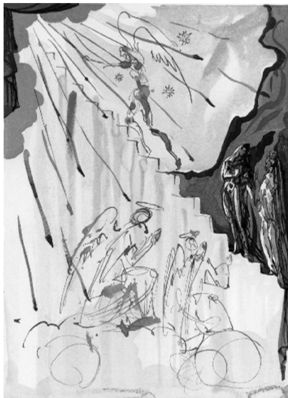
Scara de aur a cerului Saturn, Paradis 21

Se spune că cel mai genial om al secolului al XX-lea ar fi fost James Frazer. Eliade a învățat limba engleză pentru a-l studia pe Frazer și toată viața a tins să-l depășească. Unii oameni de știință afirmă că Eliade l-a ajuns, ba chiar l-a întrecut pe Frazer. Astfel, conform părerii lui Giovanni Papini, Eliade este cel mai erudit om al secolului al XX-lea. Dacă astfel stau lucrurile, de ce, dragă prietene, n-ai prelua câte ceva din felul de a citi al lui Mircea Eliade, fără a avea pretenția de a-l depăși, dar la o adică, de ce nu?