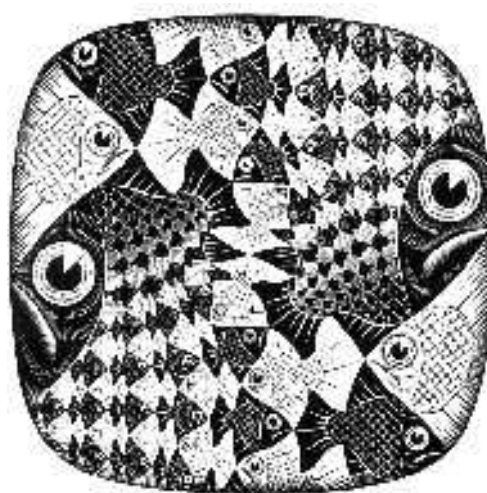
Pești și solzi

un târziu ? O arătare de om, cu mișcări molatice, cu ochi care nu exprimă altceva decât un nimic înfricoșător, care te electrocutează și te face să grăbești pasul. Vezi aceste fețe în fiecare zi, pe stradă și la televizor, seara, la știri. Târziiii participă la emisiuni televizate în cadrul cărora își bat joc de moderatori, dau tonul la consensul național în parlament, zâmbesc cu subtext atunci când le sunt adresate întrebări incomode, ne spun cu cât a mai crescut în ultimul an pibu' și câți bani s-au adunat la bu-jăt... Înțelegi că ei dețin puterea supremă în orașul tau, și nimeni